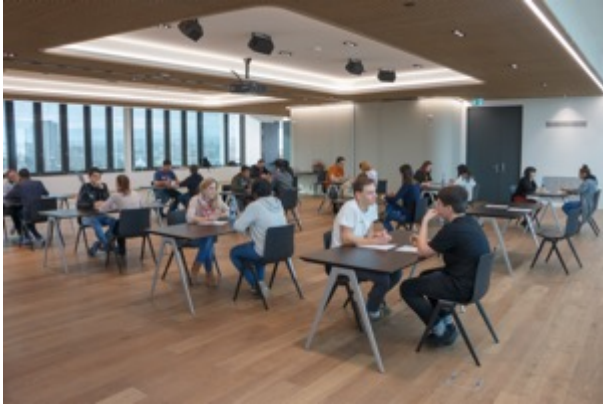
Matching November 2018