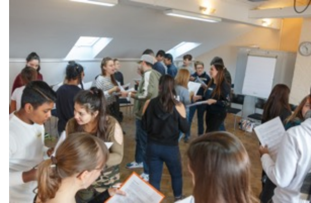
Training November 2018