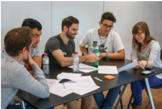
Bewerbungsworkshop April 2018